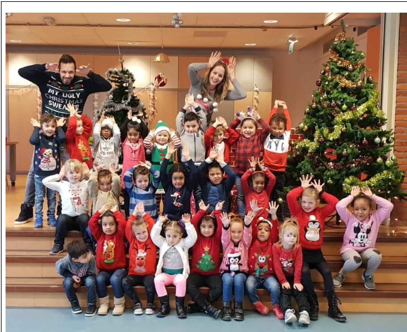
Groep ½ a ↑↑